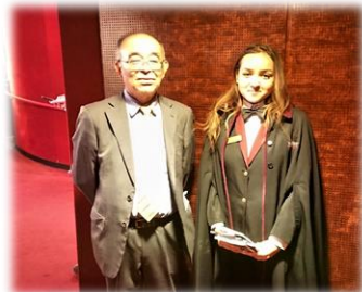
【メトロポリタン・オペラハウス スタッフとのツーショット】

自然や街並み散策や、音楽・スポーツ鑑賞などの世界を一人旅しています。早くコロナが終息し、再び気楽に海外旅行ができることを願っているこの頃です。