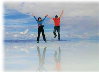
【ウユニ塩湖でジャンプ!!】2016年2月

とうとう今年古希を迎えますが、これまで家内と世界5大陸を制覇してきました。今回は、登山に最適の時期である2月の南米をご紹介します。