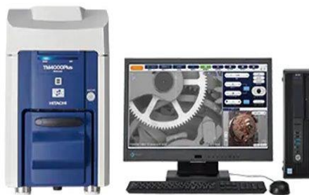
■遠方特別ゲスト： 卓上顕微鏡 Miniscope TM4000Plus II