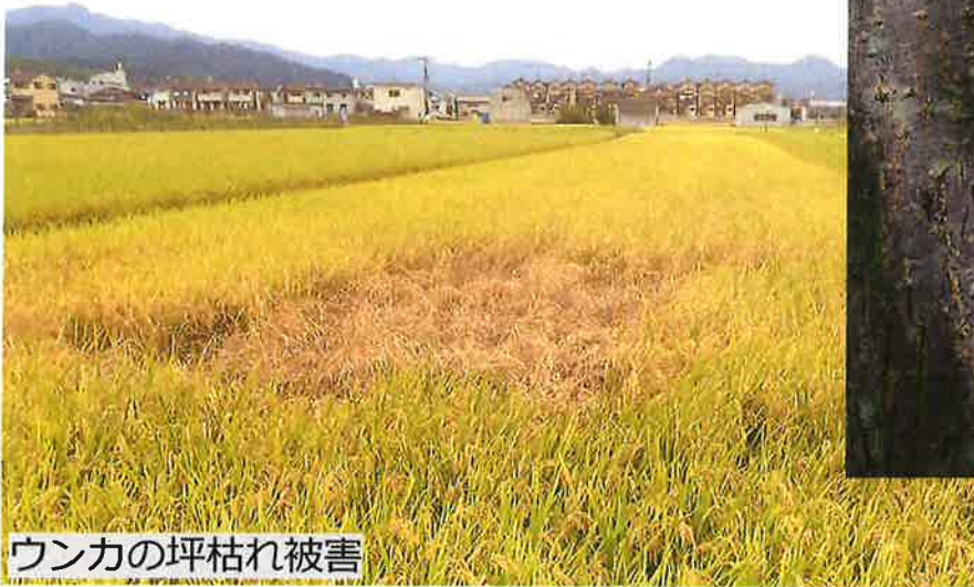
ウンカの坪枯れ被害