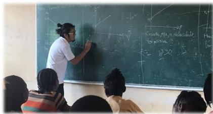
【授業中のスナップ】