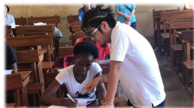
【授業中のスナップ】