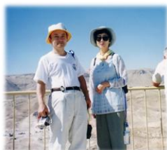
【ローマ軍と戦ったマサダの要塞跡にて】