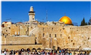
【エルサレム旧市街・嘆きの壁】