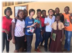
【生徒や隊員たちと】