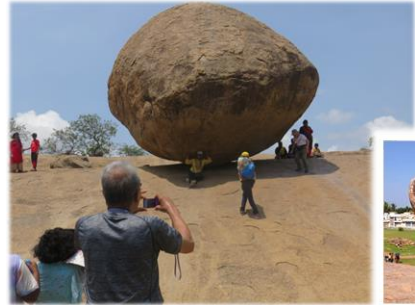
【チェンナイ南60kmにある丸い巨岩 “バターボール”と呼ばれる】