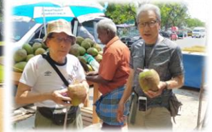
【初めて飲むココナッツジュースに ご満悦】