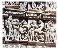
【インド・カジュラホー ヒンズー寺院の彫刻像】