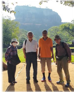
【スリランカ中部にある シーギリアロックをバックに… 1時間かけて登る頂上には、 5世紀後半の宮殿跡がある】