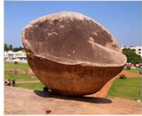
【裏へ回ると 何と中は空洞】