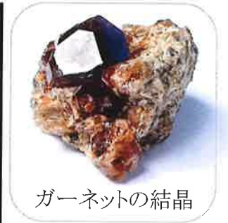
ガーネットの結晶