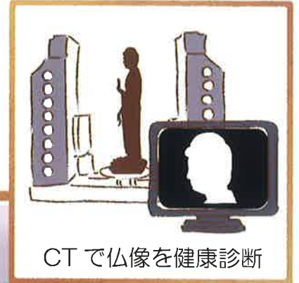
CTで仏像を健康診断